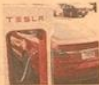
HÅLLER MÅTTET. Tesla blir den enda fordons tillverkaren som klarar de nya kraven, enligt läckta uppgifter.